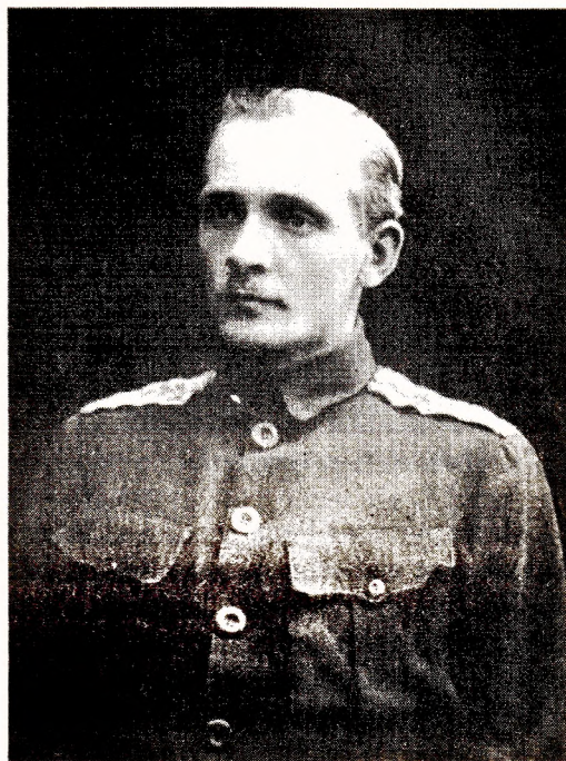
Янка Купала. 1916 г.

Мы ведаем таксама пісьмо Я. Купалы з Полацка да прафесара Браніслава Эпімаха-Шыпілы, ураджэнца Полаччыны (ад 26.09.1916). Б. Эпімах-Шыпіла – выбітны дзеяч беларускай культуры, вучоны, мовазнавец – адыграў значную ролю ў жыцці і творчасці Я. Купалы. Ён спрыяў выданню першага паэтычнага зборніка “Жалейка” Я. Купалы, ён жа памылкова перайменаваў Янука Купалу ў Янку Купалу . Паэту імя прыйшлося даспадобы і ён стаў падпісвацца толькі так. Прагнучы адукацыі, у снежні 1909 г. Я. Купала, выкарыстаўшы прапановы прафесара, паехаў у Пецярбург вучыцца і больш як тры гады жыў у кватэры Браніслава Ігнатавіча. З самага пачатку паміж маладым паэтам і прафесарам усталяваліся сяброўскія адносіны, узамаразумыненне і ўзаемападтрымка. Пра гэта свед-