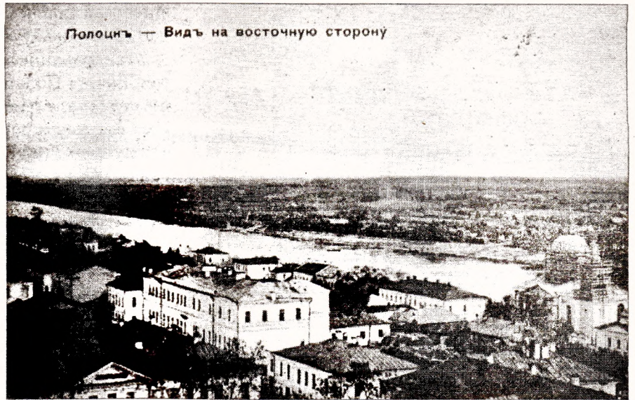
Полацк — Видъ на восточную сторону

Вольга Нікановіч-Сахарова, педагог і пісьменніца, паводле драматычнай паэмы “Сон на кургане” Я. Купалы напісала п’есу – казачную феэрыю “На Полацкім замчышчы”. У 1927 г. у Дзвінскай беларускай гімназіі па ёй быў пастаўлены спектакль.