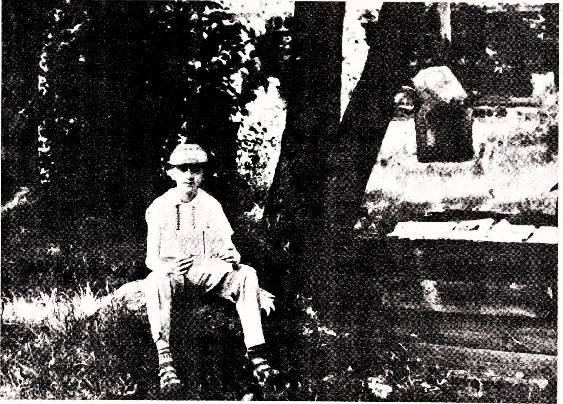
Маленькі Сяржук і тая самая студня. (Архіўнае фота).