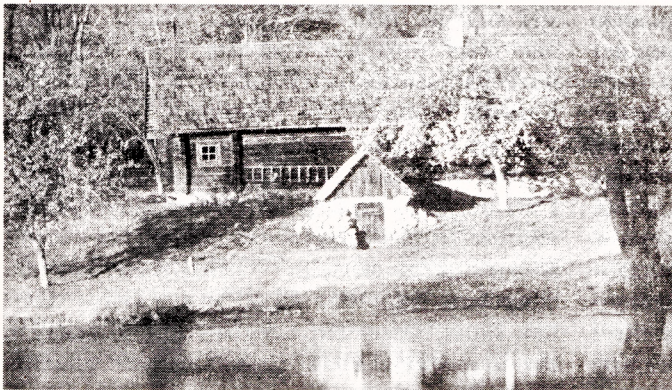
Парабкова хатка, у якой нарадзіўся Яська Луцэвіч — Янка Купала.

Яшчэ адметнасць. Купалава Вязынка — запаведнік. Яе ад суседніх