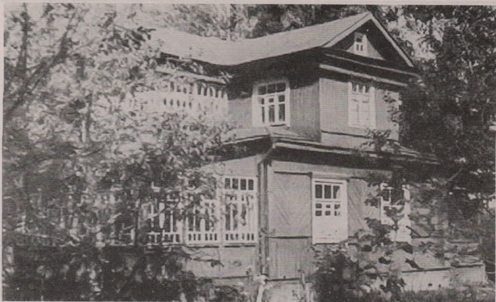
Дача А. Новикова-Прибой. 2016 г.

«Дорогого Алексея Силевича искренно поздравляем со Сталинской премией. Привет из Цхалтубо от Янки Купалы, Коласа Якуба. Купала, Колас».