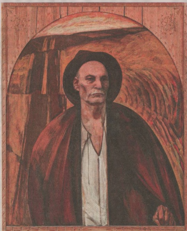
Уладзімір Стальмашонак. Партрэт Якуба Коласа, 1967 г.

катэгорыяй. Нават нягледзячы на тое, што музей Якуба Коласа — гэта дом, дзе захаваліся яго рэчы, якімі ён сам карыстаўся, у пакоях якога жыў, усё роўна цяжка ўявіць класіка як жывога чалавека. Рана ці позна гэта здараецца з любым творцам. Ён раствараецца ў медыяполі, з некаторымі гэта здараецца нават пры жыцці, як у сітуацыі з Джэромам Сэлінджэрам. Выявы Якуба Коласа сталі настолькі звыклымі, што ў нейкі момант можа нават здацца: гэта згенерываныя нейрасецівам партрэты «тыповага беларуса». Адзіны спосаб