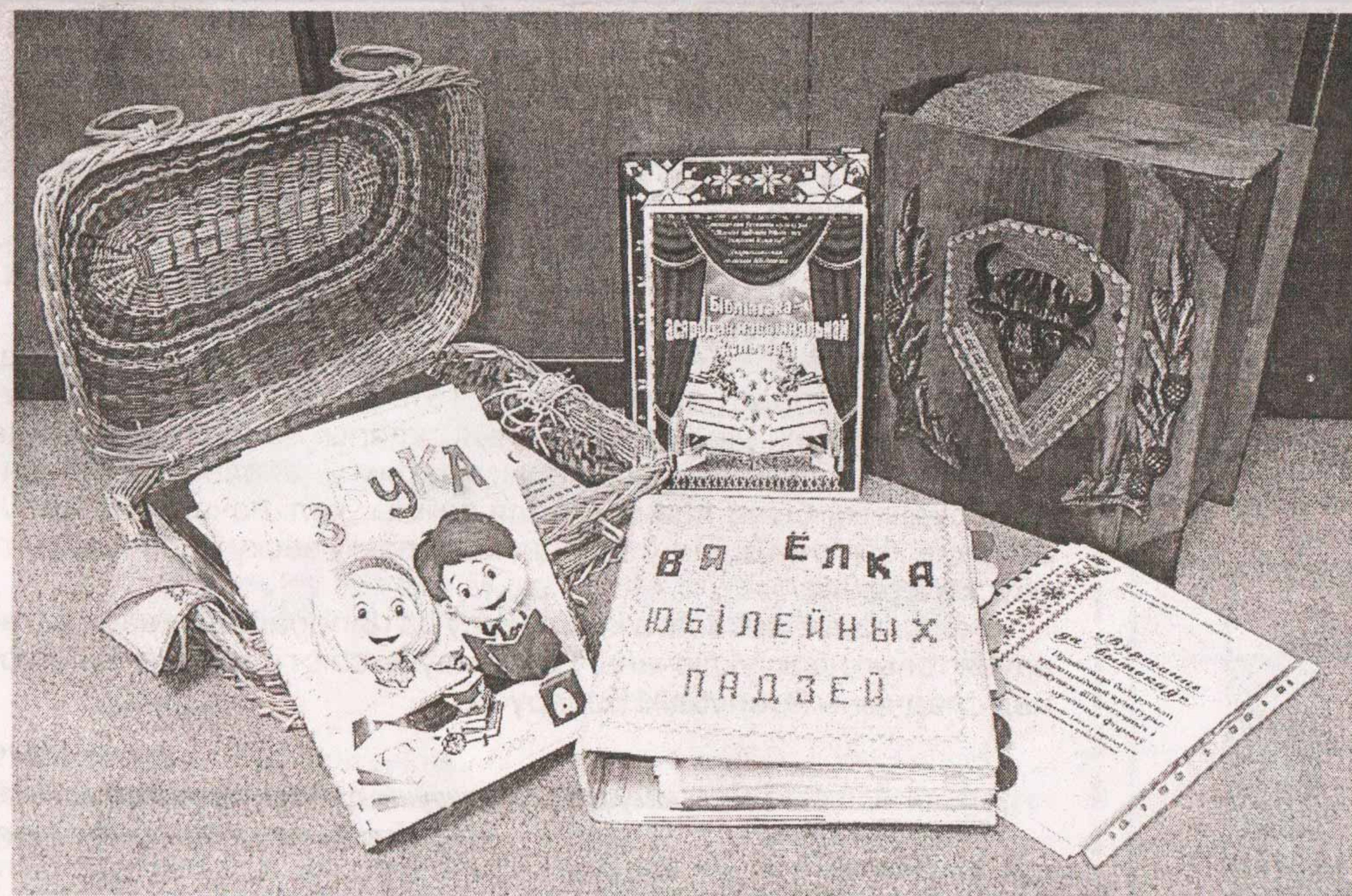
Матэрыялы бібліятэк-пераможцаў у намінацыі «За значны ўклад у выхавальную работу з падростаючым пакаленнем»

стаецца інавацыйным падыходам, у аснове якога – інтэрактыўныя формы правядзення масавых мерапрыемстваў: прэзентацыі кніг, хіт-парады, флэшмобы, віртуальныя турніры, мастац-