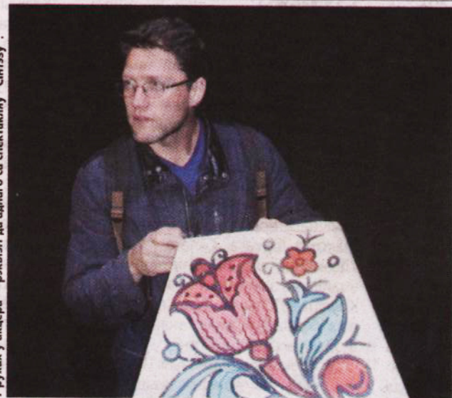
У руках у акцёра — рэжысёр да аднаго са спектакляў “Сінгаў”.