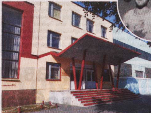
Палац культуры "Беліцкі".