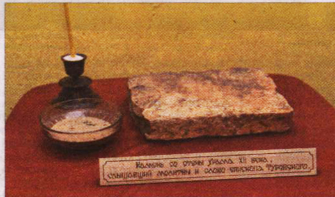
■ Камень со стены храма XII века, где молился Кирилл Туровский.