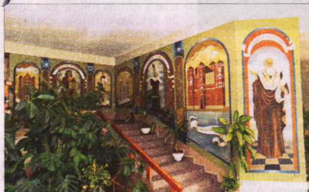
■ Тематическая роспись на стенах библиотеки.

Сегодня в центре хранится более двух тысяч томов православной литературы. Украшением этого фонда послужит роскошная подарочная Библия в кожаном переплёте, которую по случаю круглой даты преподнёс епископ Гомельский и Жлобинский Стефан. Владыка благословил сотрудников би-