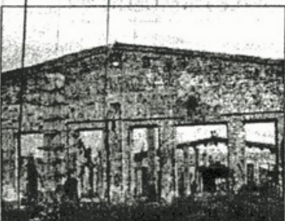
Завод после освобождения