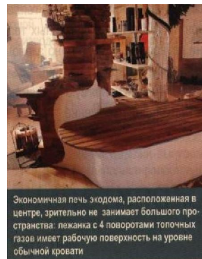
Экономичная печь экодома, расположенная в центре, зрительно не занимает большого пространства: лжанка с 4 поворотами топочных газов имеет рабочую поверхность на уровне обычной кровати