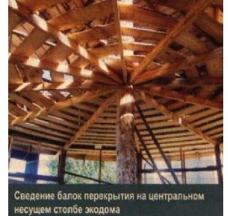
Сведение балок перекрытия на центральном несущем столбе экодома