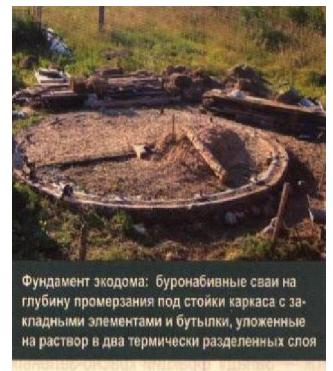
Фундамент экодома: буронабивные сваи на глубину промерзания под стойки каркаса с закладными элементами и бутылки, уложенные на раствор в два термически разделенных слоя