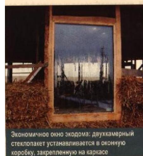
Экономичное окно экодома: двухкамерный стеклопакет устанавливается в оконную коробку, закрепленную на каркасе